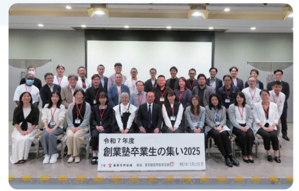
創業塾卒業生の集い 参加者一同

東栄信用金庫主催の「創業塾」に参加したことが、東京都よろず支援拠点を利用するきっかけとなりました。毎年、東栄信用金庫では卒業生向けのイベントを行っており、今回は、AIを活用した経営術に関するテーマでした。参加者同士で困りごとを共有しながらAIを実際に触れることで、“質問の仕方ひとつでAIの回答がより実務的で深い内容になる”という気づきを得ることができました。創業塾の仲間と再会し、互いの悩みを共有できたことも大きな励みになりました。これからも東栄信用金庫、東京都よろず支援拠点のコーディネーターと相談をしながら、事業を一歩ずつ前に進めていきたいと思えます。